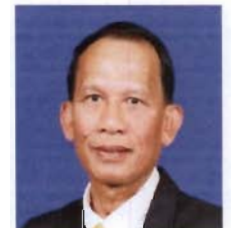
ศาสตราจารย์โกวิท พวงงาม ที่ปรึกษาคณะกรรมการ