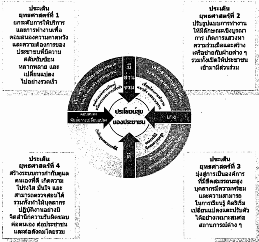
ภาพที่ 1 กรอบแนวคิดการพัฒนากระบวนการไทย