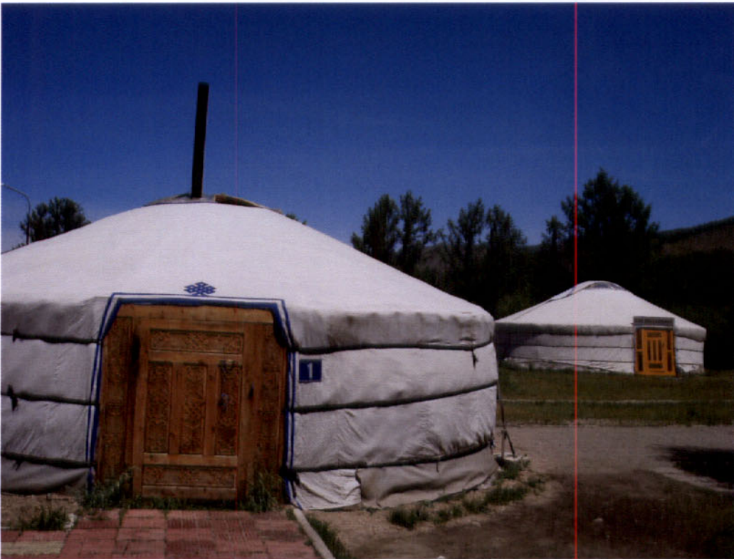
ภาพกระโจม (Ger)