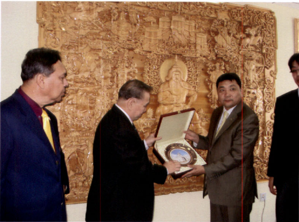
การพบปะสนทนากับนาย Luimed GANSUKH รัฐมนตรีว่าการกระทรวงสิ่งแวดล้อมและการท่องเที่ยว ในวันอังคารที่ ๓๐ มิถุนายน ๒๕๕๒