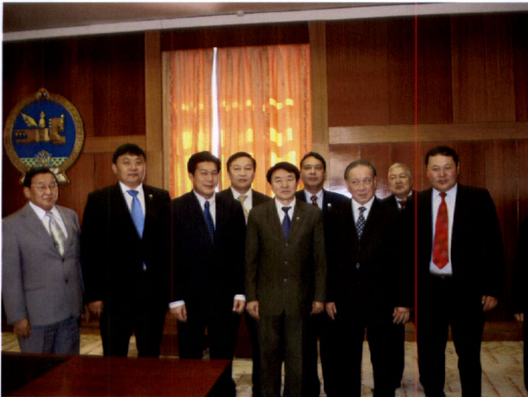
การเข้าเยี่ยมชมคารวะนาย Damdingiin DEMBEREL ประธานรัฐสภามองโกเลีย ในวันจันทร์ที่ ๒๙ มิถุนายน ๒๕๕๒