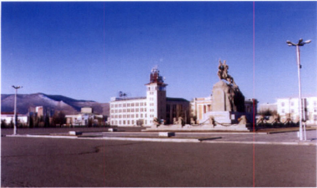
ภาพจัตุรัส Sukhabaatar (Sukhabaatar Square)