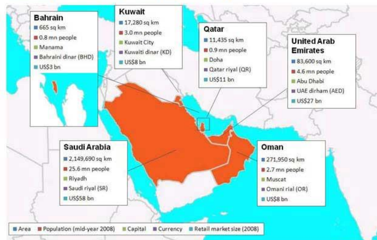
ประเทศสมาชิกคณะมนตรีความร่วมมืออ่าวอาหรับ (Gulf Cooperation Council : GCC)