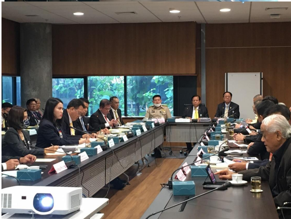
การประชุมคณะอนุกรรมการ