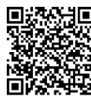
บันทึกการประชุมสภา สำนักรายงาน การประชุมและชวเลข