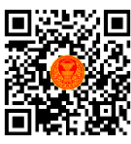
กระทู้ถามสด ด้วยวาจา