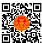
หนังสือนัดประชุม และระเบียบวาระการประชุม สภาผู้แทนราษฎร

รายงานการประชุมสภาผู้แทนราษฎร ชุดที่ ๒๕ ปีที่ ๓ (สมัยสามัญประจำปีครั้งที่หนึ่ง) ครั้งที่ ๑ เป็นพิเศษ และครั้งที่ ๒ เป็นพิเศษ ได้วางให้ท่านสมาชิกฯ ตรวจสอบเมื่อวันที่ ๒๒ ธันวาคม ๒๕๖๔ บริเวณหน้าห้องประชุม สภาผู้แทนราษฎร ชั้น ๒ อาคารรัฐสภา ก่อนเสนอให้ที่ประชุมสภาผู้แทนราษฎรรับรอง รวมถึงจัดให้มี ข้อมูลในรูปแบบหนังสืออิเล็กทรอนิกส์ เพื่อให้สมาชิกฯ ตรวจสอบดูรายงานการประชุมได้ตามที่ร้องขอ ตามข้อบังคับฯ ข้อ ๓๓ วรรคหนึ่ง ประกอบกับข้อ ๔ ของประกาศสภาผู้แทนราษฎร เรื่อง หลักเกณฑ์ และวิธีการขอตรวจดูรายงานการประชุมทางสื่ออิเล็กทรอนิกส์หรือสื่อเทคโนโลยีสารสนเทศ พ.ศ. ๒๕๖๒