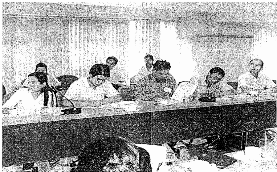
ผู้เข้าร่วมสัมมนา ร่วมคิดร่วมเสนอ ประสบการณ์การ ทำงานในท้องถิ่น รับฟังการบรรยาย ของวิทยากร