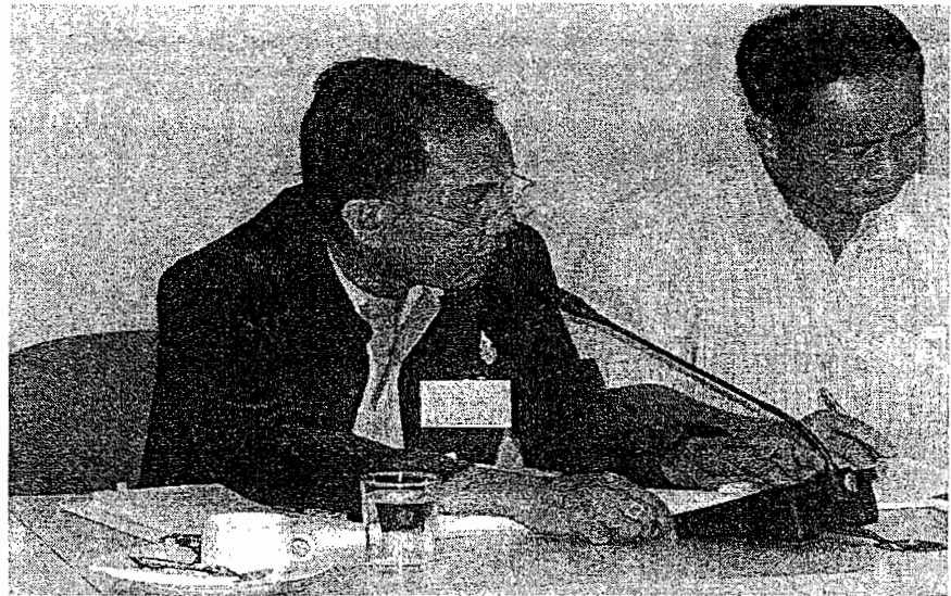
ผู้เข้าร่วมสัมมนา นำเสนอความคิด ประสบการณ์ การทำงานขององค์กร บริหารส่วนท้องถิ่น