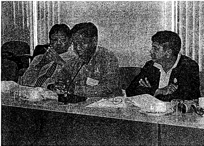
ผู้นำชุมชน จังหวัดนครศรีธรรมราช ร่วมอภิปราย แสดงความคิดเห็น