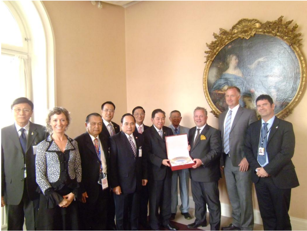
๓.๒ นายธนรัตน์ ธนพุทธิ เอกอัครราชทูต ณ กรุงสตอกโฮล์ม เป็นเจ้าภาพเลี้ยงรับรอง อาหารค่ำเพื่อเป็นเกียรติแก่คณะผู้แทนกลุ่มมิตรภาพฯ ไทย-สวีเดน ณ ทำเนียบเอกอัครราชทูต วันศุกร์ที่ ๘ มิถุนายน ๒๕๕๕ เวลา ๑๘.๐๐ นาฬิกา