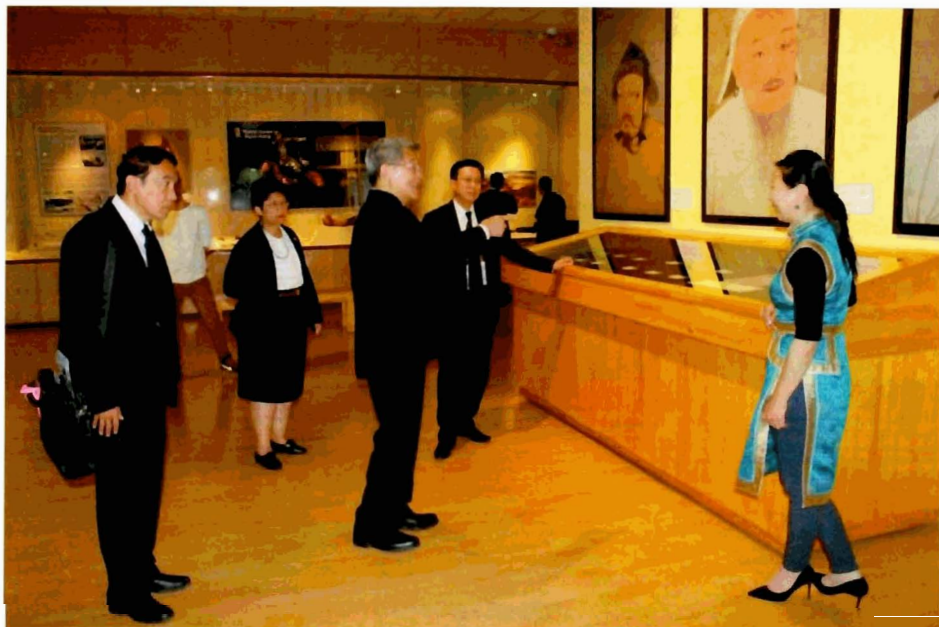
คณะได้เยี่ยมชมพิพิธภัณฑ์แห่งชาติมองโกเลีย (National Museum of Mongolia)

พิพิธภัณฑ์แห่งชาติมองโกเลียสร้างขึ้นเมื่อปี ๒๕๑๔ เป็นพิพิธภัณฑ์ที่ใหญ่ที่สุดในประเทศ ปัจจุบันได้เก็บรักษาวัตถุโบราณไว้มากกว่า ๕๗,๐๐๐ ชิ้น โดยวัตถุโบราณที่มีแสดงแบ่งเป็นประวัติศาสตร์เอเชียกลางและประวัติศาสตร์มองโกเลีย เริ่มตั้งแต่มองโกเลียยุคก่อนประวัติศาสตร์จนถึงช่วงสิ้นสุดวรรษที่ ๒๐ โดยภายในพิพิธภัณฑ์ได้แบ่งห้องแสดงออกเป็น ๑๐ ห้อง ได้แก่ ห้องแสดงประวัติศาสตร์มองโกเลียยุคโบราณ ห้องแสดงเสื้อผ้าและเครื่องประดับขามองโกลสมัยก่อน ห้องแสดงจักรวรรดิมองโกเลีย ห้องแสดงวัฒนธรรมดั้งเดิมมองโกเลีย ห้องแสดงวิถีชีวิตของขามองโกลโบราณ ห้องแสดงประวัติศาสตร์มองโกเลียในช่วงศตวรรษที่ ๑๗-๒๐ ห้องแสดงประวัติศาสตร์มองโกเลียช่วง พ.ศ. ๒๔๕๔-๒๔๖๓ ห้องแสดงประวัติศาสตร์มองโกเลียช่วงสังคมนิยมมองโกเลีย ๒๔๖๔-๒๕๓๓ และห้องแสดงประวัติศาสตร์มองโกเลียช่วง ๒๕๓๓-ปัจจุบัน