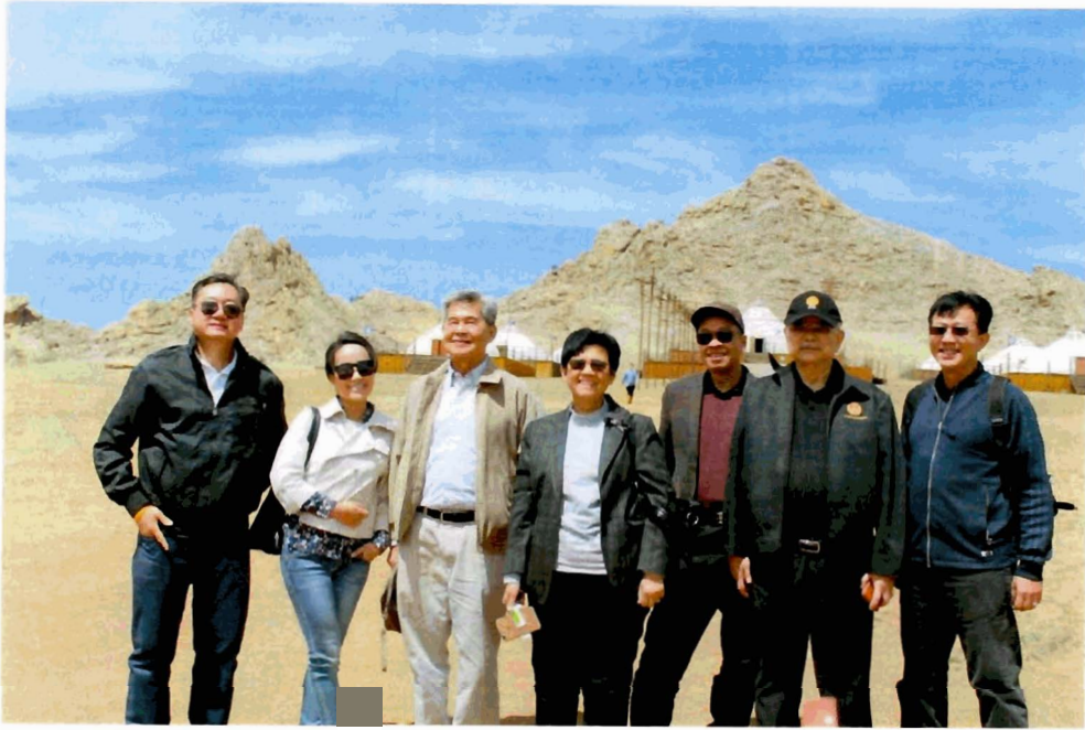
13th Century Complex