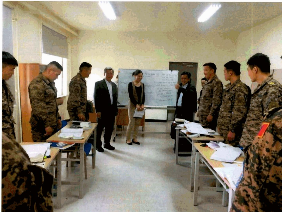
คณะได้เยี่ยมชม PKO Training Center