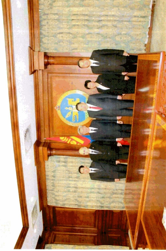
การประชุมทวิภาคีกับ H.E. Mr. Miyegombo Enkhbold ประธานรัฐสภามองโกเลีย