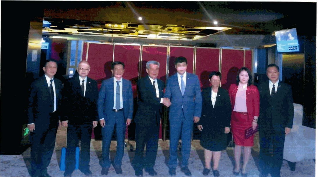
Hon. Mr. Khayangaa Bolorchuluun ประธานกลุ่มมิตรภาพรัฐสภามองโกเลีย-ไทย เป็นเจ้าของภาพเลี้ยงอาหารค่ำเพื่อเป็นเกียรติแก่คณะ