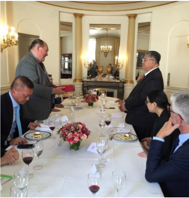
๖.๓ กลุ่มมิตรภาพฝรั่งเศส-ไทย สภาผู้แทนราษฎรฝรั่งเศส เป็นเจ้าภาพเลี้ยงอาหารกลางวันแก่คณะ เมื่อวันพุธที่ ๓๐ พฤษภาคม ๒๕๖๑ เวลา ๑๓.๐๐ นาฬิกา ณ ห้องอาหารสมาชิกสภาผู้แทนราษฎร กรุงปารีส