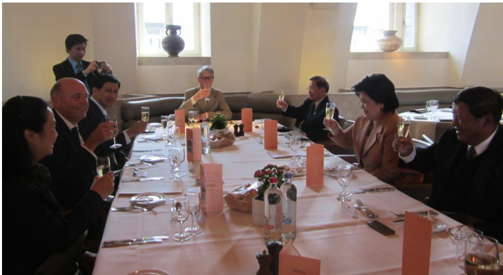
กลุ่มมิตรภาพฯ เบลเยียม-ไทยเป็นเจ้าภาพเลี้ยงรับรองอาหารกลางวันแก่คณะ

๓.๑ งานเลี้ยงรับรองอาหารกลางวันเพื่อเป็นเกียรติแก่คณะฯ โดยนาย Georges Dallemagne สมาชิกสภาผู้แทนราษฎรและสมาชิกกลุ่มมิตรภาพฯ เบลเยียม-ไทย เป็นเจ้าภาพ ในวันอังคารที่ ๒๘ พฤษภาคม พ.ศ. ๒๕๕๖ เวลา ๑๒.๓๐ นาฬิกา ณ ห้องอาหารอาคารรัฐสภา