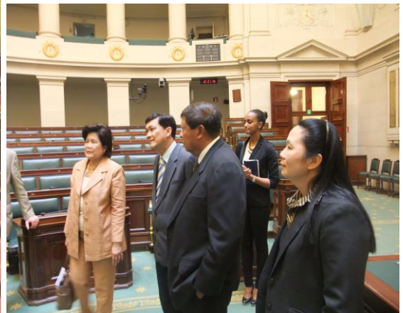
คณะเยี่ยมชมห้องประชุมวุฒิสภาและสภาผู้แทนราษฎร