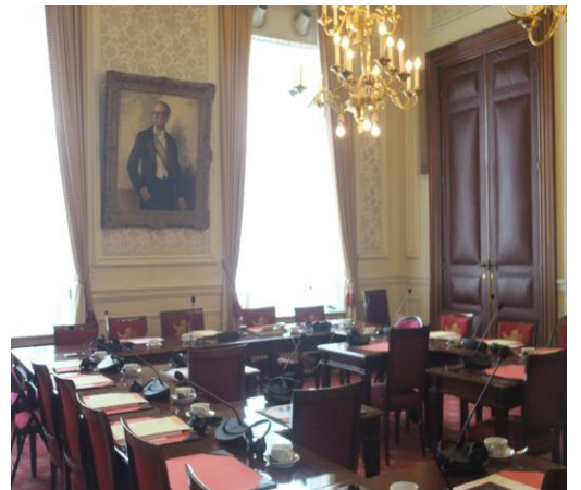
คณะผู้แทนฯ เยี่ยมชมห้องประชุมคณะกรรมการ

ห้องอ่านหนังสือของสมาชิกวุฒิสภาและสมาชิกสภาผู้แทนราษฎรจะแยกออกจากกัน แต่จะประกอบด้วยหนังสือ หนังสือพิมพ์ สื่อสิ่งพิมพ์ภาษาต่างๆ เพื่อให้ข้อมูลแก่สมาชิกรัฐสภา กลางห้องอ่านหนังสือมีเตาไฟจากอิตาลี ส่วนหน้าต่างห้องอ่านหนังสือของสมาชิกสภาผู้แทนราษฎรจะสามารถมองเห็นสวนของพระราชวังได้