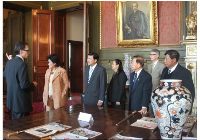
คณะเยี่ยมชมห้องอ่านหนังสือสมาชิกสภาผู้แทนราษฎรและวุฒิสภา

การประชุมและเอกสารการประชุมสภาผู้แทนราษฎรและการประชุมวุฒิสภาจะใช้ภาษาฝรั่งเศสและภาษาดัตช์เป็นหลัก ซึ่งในห้องประชุมจะมีตู้สำหรับล่ามในการทำหน้าที่ ๓ ตู้ สำหรับภาษาฝรั่งเศส ดัตช์ และภาษาอื่นๆ (หากมีเพิ่มเติม) แต่ในวาระสำคัญ อาทิ พระมหากษัตริย์เข้าสาบานตนต่อรัฐสภาจะมีการแปลเป็น ๓ ภาษา คือภาษาฝรั่งเศส ภาษาดัตช์ และภาษาเยอรมัน ที่นั่งด้านซ้ายของบัลลังก์จะเป็นที่นั่งของเลขาธิการฯ ผนังโดยรอบห้องประชุมจะประดับด้วยภาพของบุคคลสำคัญทางประวัติศาสตร์ของเบลเยียม และเพดานจะเป็นประดับด้วยสรรพาวุธ ๙ แฉก ซึ่งแสดงถึงจังหวัดทั้ง ๙ ในเบลเยียม วุฒิสภาจะมีการประชุมในวันพฤหัสบดี และสภาผู้แทนราษฎรมีการประชุมในวันพุธและพฤหัสบดี สมาชิกที่อยู่ในห้องประชุมจำเป็นต้องลงคะแนนเสียง หากไม่ประสงค์จะลงคะแนนสมาชิกท่านนั้นจะต้องออกจากห้องประชุม