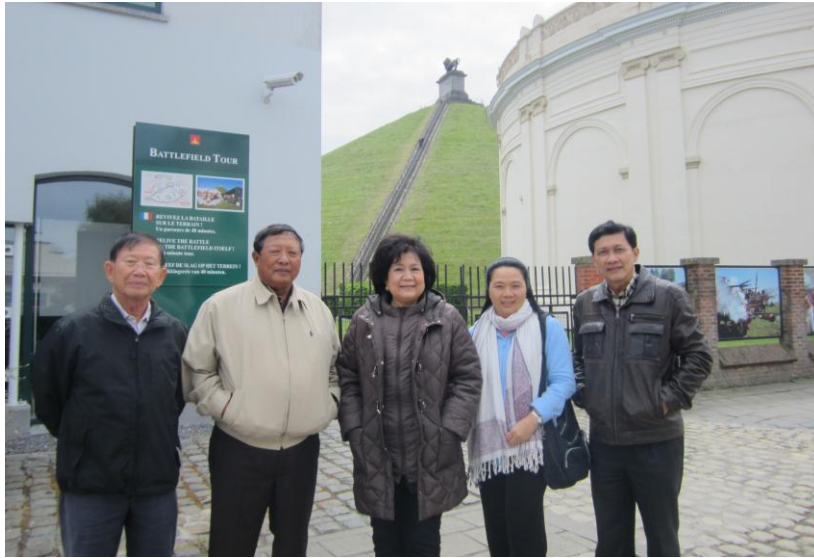
คณะถ่ายภาพบริเวณพิพิธภัณฑน์วอเตอร์ลู