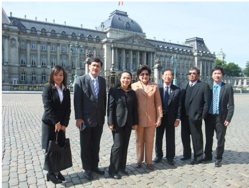
คณะผู้แทนฯ ถ่ายภาพด้านหน้าพระราชวังหลวง

พระราชวังหลวงเป็นสถานที่สำหรับพระมหากษัตริย์และพระราชินีเบลเยียม ตั้งอยู่บริเวณใจกลางเมืองหลวงของกรุงบรัสเซลส์ แต่ไม่ได้เป็นที่พำนักของราชวงศ์แต่อย่างใด เนื่องจากพระมหากษัตริย์และราชวงศ์อาศัยอยู่ที่ปราสาทหลวง Laeken ซึ่งอยู่นอกกรุงบรัสเซลส์ ด้านหน้าของพระราชวังเป็นที่ตั้งของสวนสาธารณะกรุงบรัสเซลส์ และอีกฝั่งของสวนสาธารณะเป็นอาคารรัฐสภาเบลเยียม