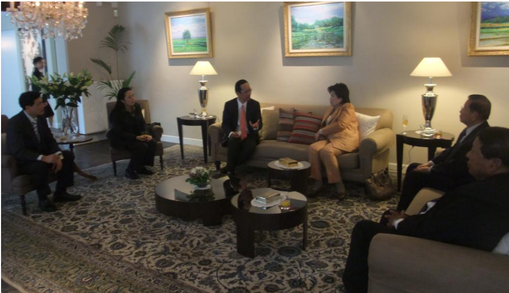
คณะเข้าเยี่ยมคารวะเอกอัครราชทูตฯ

ประชาชนในภูมิภาคนั้นๆ มักใช้ภาษาเดียวกัน ภูมิภาคจะได้รับการจัดสรรงบประมาณเป็นจำนวนมากและมีอำนาจการตัดสินใจมาก อาทิ กรณีการเป็นสมาชิกภาพของสหภาพยุโรป ซึ่งจะต้องผ่านการเห็นชอบจากสภายุโรป รัฐสภาของทั้ง ๒๕ ประเทศสมาชิก เมื่อวาระดังกล่าวผ่านมายังรัฐสภาเบลเยียมแล้ว ยังคงต้องผ่านความเห็นชอบจากสภาของ ๖ ภูมิภาคอีกด้วย หรือ กรณีการส่งเจ้าหน้าที่มาประจำยังสถานเอกอัครราชทูตของราชอาณาจักรเบลเยียมอาจมีการส่งตัวแทนเจ้าหน้าที่ทางการทูตจากรัฐบาลกลางและรัฐบาลภูมิภาคเข้าทำหน้าที่ในประเทศนั้นด้วย เมื่อพิจารณาอำนาจหน้าที่ของรัฐบาลภูมิภาคในเรื่องที่เกี่ยวข้องกับเศรษฐกิจและการค้ากับต่างประเทศแล้ว รัฐบาลภูมิภาคจึงมีอำนาจการตัดสินใจค่อนข้างมาก การลงนามของรัฐบาลกลางในเรื่องใดจึงต้องผ่านความเห็นจากรัฐบาลภูมิภาคด้วย เนื่องจากรัฐบาลภูมิภาคเป็นผู้นำเสนอรายได้ให้แก่รัฐบาลกลางจึงมีอำนาจการตัดสินใจสูง ฉะนั้น การติดต่อด้านการค้าผ่านรัฐบาลภูมิภาคจึงเป็นช่องทางที่น่าสนใจในการทำธุรกิจของไทย