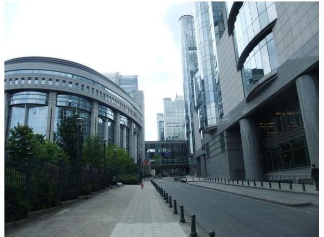
คณะถ่ายภาพด้านนอกอาคารรัฐสภายุโรป