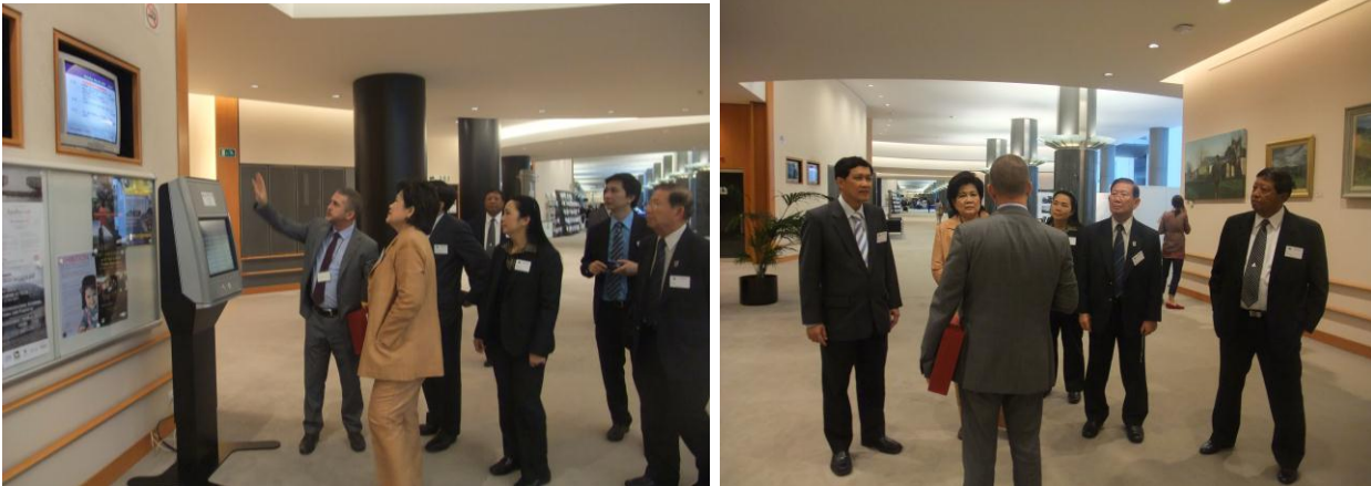
คณะเยี่ยมชมรัฐสภายุโรป