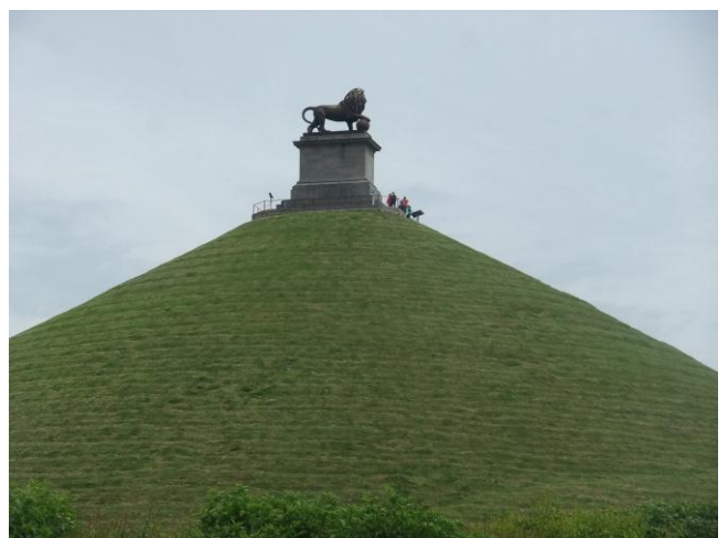
คณะถ่ายภาพบริเวณอนุสาวรีย์วอเตอร์ลู