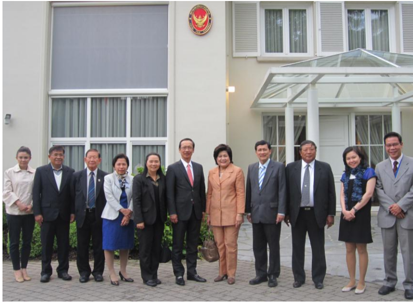
คณะถ่ายภาพร่วมกับเจ้าหน้าที่สถานเอกอัครราชทูต ณ กรุงบรัสเซลส์