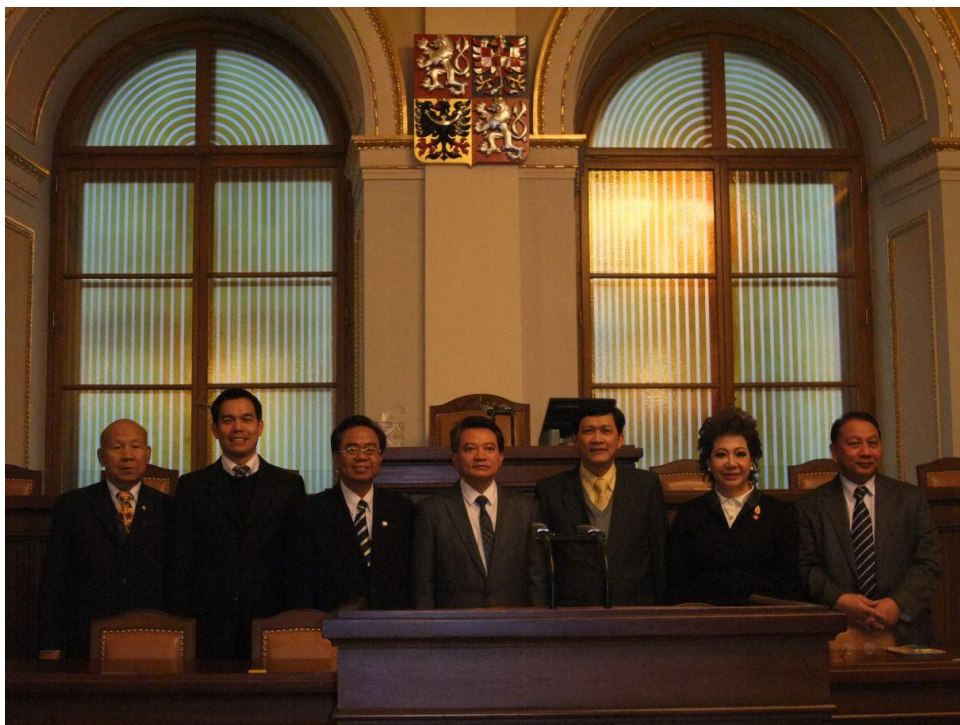
ห้องประชุมสภาผู้แทนราษฎร โดยด้านหลังเป็นบัลลังก์ของประธานสภาผู้แทนราษฎร