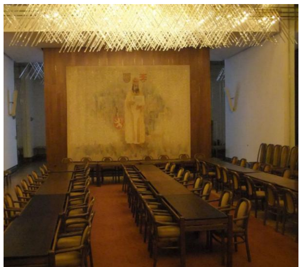
พื้นที่พักผ่อนของสมาชิกสภาผู้แทนราษฎร