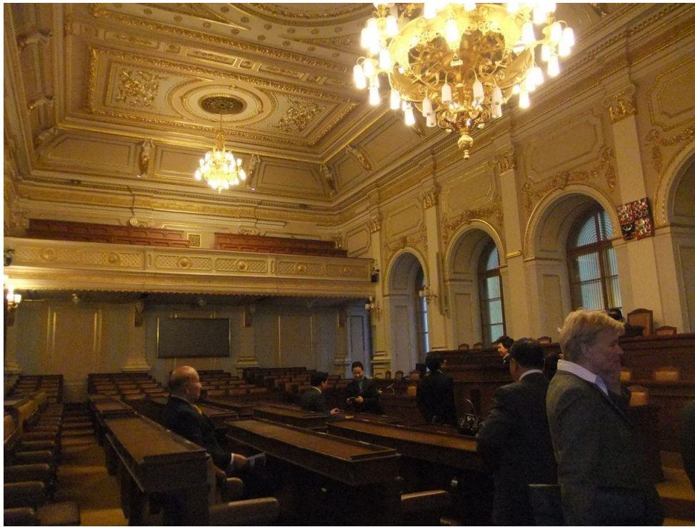
ห้องประชุมสภาผู้แทนราษฎร