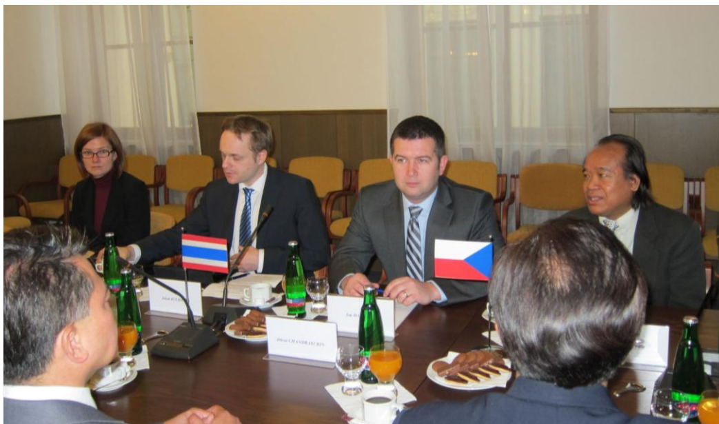
รองประธานสภาผู้แทนราษฎรสาธารณรัฐเช็ก (คนที่ ๒ จากขวามือ)

สำหรับความร่วมมือทางการทหาร จะเห็นได้ว่า รัฐบาลของสาธารณรัฐเช็กและรัฐบาลไทย พิจารณาใช้เครื่องบินรบรุ่นกริฟเพนเช่นเดียวกัน โดยสาธารณรัฐเช็กได้ขอเสนอตัวเข้าเป็นฝ่ายซ่อมบำรุงเครื่องบินรบที่ประจำการในประเทศไทย ซึ่งขณะนี้อยู่ระหว่างการพิจารณาของรัฐบาลไทย