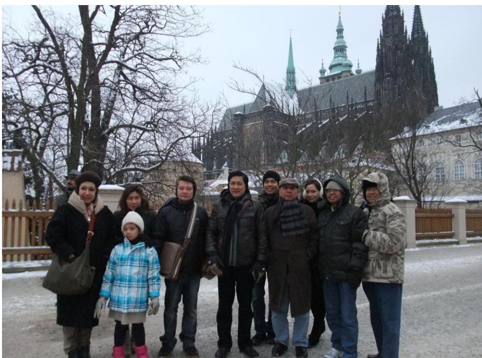
คณะผู้แทนฯ ถ่ายภาพร่วมกันบริเวณหน้าปราสาทปราก เมื่อวันที่ ๒๐ มกราคม ๒๕๕๖

ปราสาทปรากเป็นสถานที่สำคัญที่สุดในสาธารณรัฐเช็ก เปรียบเสมือนสัญลักษณ์ของประเทศที่ชาวเช็กรักและภาคภูมิใจ เริ่มสร้าง ขึ้นในศตวรรษที่ ๙ ประกอบด้วยสิ่งก่อสร้าง อาทิ พระราชวัง โบสถ์ สวนหย่อม และพิพิธภัณฑสถานที่เป็นเสมือนมรดกทางวัฒนธรรมของศิลปะ ในยุคสมัยต่าง ๆ รวมไว้ด้วยกัน ปราสาทแห่งนี้เคยเป็นพระราชวังสำหรับราชวงศ์ในช่วงเวลาหนึ่ง อย่างไรก็ตามในปัจจุบันปราสาทแห่งนี้เป็นสถานที่ทำงานของประธานาธิบดี