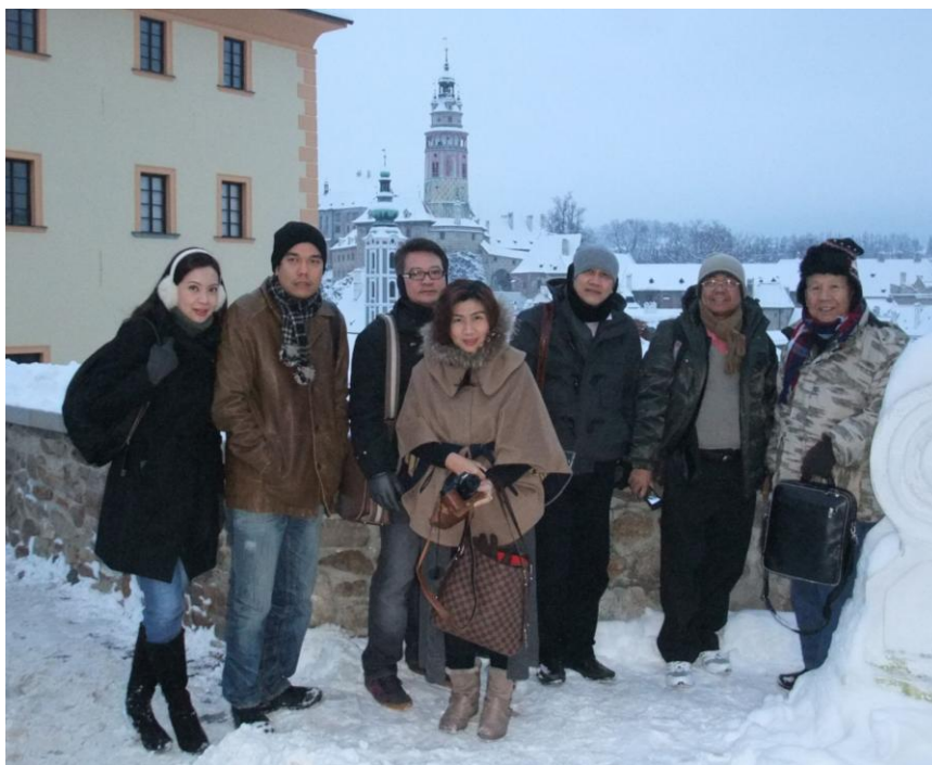
คณะผู้แทนฯ เดินทางเยี่ยมชมเมืองเชสกี ครูมลอฟ เมื่อวันที่ ๑๙ มกราคม ๒๕๕๖

ปราสาทมีส่วนหนึ่งเป็นป้อมปราการยุคกลาง และอีกส่วนเป็นคฤหาสน์ขนาดใหญ่ ตั้งอยู่บนยอดหน้าผาอย่างโดดเด่นและสามารถมองเห็นวิวเมืองโดยรอบ อย่างไรก็ตาม ปราสาทแห่งนี้มีขนาดใหญ่เป็นอันดับสองในดินแดนเช็ก รองจากปราสาท กรุงปราก ปราสาทยุคเรอเนสซองซ์อันยิ่งใหญ่แห่งนี้ครั้งหนึ่งเคยเป็นที่อยู่ของลอร์ดส์ โรเซนเบิร์ก และลอร์ดส์ ชวาร์เซนเบิร์ก ผู้ทรงอำนาจ ปัจจุบันเป็นที่เก็บรวบรวมเฟอร์นิเจอร์สไตล์ที่เรียดของอังกฤษ สิ่งทอของชาวเฟลมิช รวมถึงอาวุธทางประวัติศาสตร์และมีหอศิลป์ภาพด้วย ปราสาทได้ถูกสร้างขึ้นราวศตวรรษที่ ๑๓ โดยมีองค์ประกอบในสไตล์โกธิก เรอเนสซองซ์ และบารอก