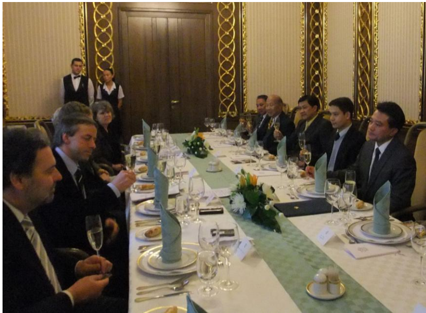
งานเลี้ยงรับรองอาหารกลางวันโดยประธานกลุ่มมิตรภาพฯ เช็ก-อาเซียน (คนที่ ๒ จากซ้ายมือ)

นอกจากนี้ นาย Radek John ได้กล่าวเสริมว่าในสมัยที่ตนเป็นรัฐมนตรีว่าการกระทรวงมหาดไทย สาธารณรัฐเช็กก็มีความพยายามอย่างเต็มที่ที่จะทำให้เกิดความเท่าเทียมกันในเรื่องการขอตรวจลงตรากับประเทศต่าง ๆ พร้อมยกตัวอย่างว่าชาวเช็กที่จะเดินทางไปประเทศแคนาดา ก็จำเป็นต้องขอวีซ่า แต่ชาวแคนาดาที่เดินทางมาสาธารณรัฐเช็กไม่จำเป็นต้องขอวีซ่า ทำให้ตนเข้าใจถึงความรู้สึกของชาวไทยเช่นกัน อย่างไรก็ตาม ในความเห็นของตนคิดว่า ควรจะมีการร่วมมือกันทั้งสองฝ่าย กล่าวคือ เอกอัครราชทูตไทย ก็ น่าจะดำเนินการเชิงรุกเพื่อผลักดันในเรื่องนี้ให้สำเร็จต่อไป