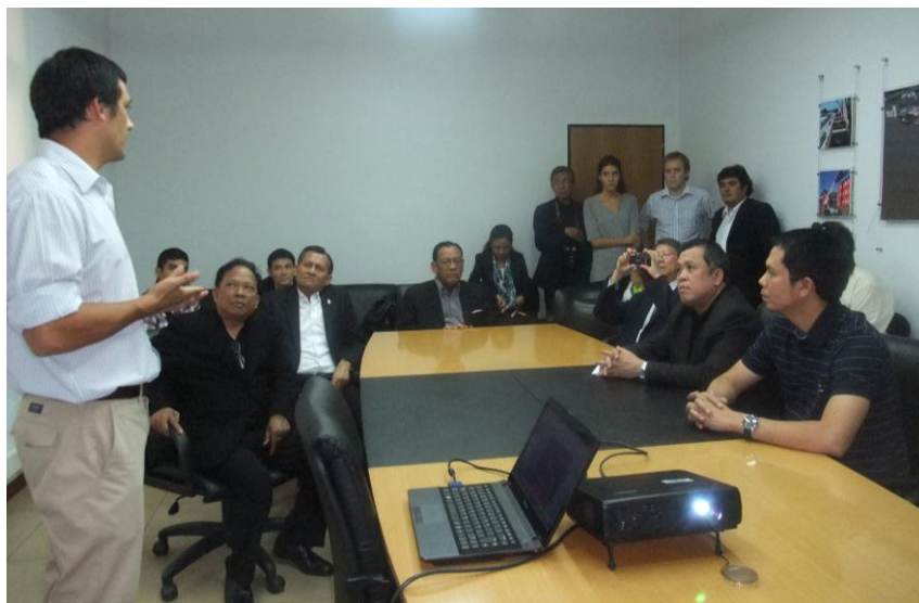
การรับฟังข้อมูลการบริหารท่าเรือ

ผู้จัดการฝ่ายปฏิบัติการ นำเสนอว่า บริษัท TPR เป็นท่าเช่าพื้นที่ในหลายวัตถุประสงค์ (สำหรับตู้คอนเทนเนอร์ เรือขนส่งสินค้าแบบโต้ท้องเรือ เรือบรรทุกของแห้ง และเรือบรรทุกของเหลว) โดยมุ่งเน้นความพึงพอใจของลูกค้าเป็นหลักเพื่อการทำงานในระยะยาว ตั้งอยู่ที่เขตซานตาเฟ สามารถเชื่อมต่อไปยังมหาสมุทรแอตแลนติก ได้โดยตรงโดยผ่านแม่น้ำปารานา เปิดทำการเมื่อวันที่ ๑๖ ตุลาคม ค.ศ. ๒๐๐๒ เส้นทางขนส่งหลักอยู่ที่อาร์เจนตินา (ตอนกลาง ตอนเหนือ ตะวันออก และตะวันตก) บราซิล (ในพื้นที่ Corumbá) โบลิเวีย ตะวันออก และปารากวัย มีพื้นที่ให้บริการทางน้ำมีอาณาเขต ๖๖.๙ เฮกเตอร์ ทำเทียบเรือขนาด ๑.๖ เมตร ซึ่ง TPR เป็นท่าเรือสุดท้ายของแม่น้ำปารานา โดยมีการเชื่อมต่อที่ดีกับพื้นที่ต่างๆ โดยผ่านทางแม่น้ำปารานา ถนนไฮเวย์หมายเลข ๙ และรถไฟ ๕ สายที่เชื่อมต่อตรงเข้ามายังพื้นที่ของ TPR สินค้าหลักในการขนส่งของ TPR ได้แก่ แร่เหล็ก ถั่วเหลือง น้ำมันจากดอกทานตะวัน ไวน์ และผลไม้ ปัจจุบันมีพนักงานจำนวน ๒๕๐ คน