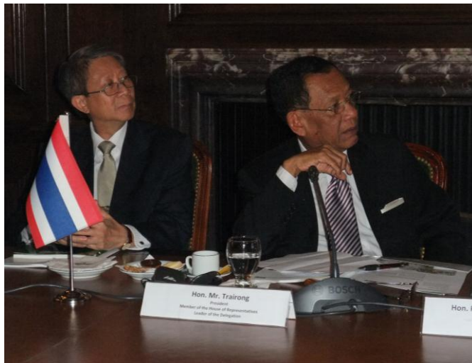
เอกอัครราชทูต ณ กรุงบัวโนสไอเรส และประธานกลุ่มมิตรภาพฯ ไทย-อาร์เจนตินา ในการพบกับตัวแทนบริษัท INVAP

ตัวแทนบริษัท INVAP กล่าวตอบว่า บริษัทมีตัวแทนในหลายๆ ประเทศ โดยทำหน้าที่เป็นผู้ให้คำแนะนำแก่รัฐบาลและประเทศนั้นๆ ซึ่งการทำงานของบริษัทเป็นไปตามกฎระเบียบสากล การควบคุมโรงงานมีความเข้มงวดมากขึ้นภายหลังจากเหตุการณ์ ๑๑ กันยายน บริษัทมีการพัฒนาในเรื่องระบบสาธารณสุขโรค ซึ่งการพัฒนาทางด้านเทคโนโลยีและระบบสาธารณสุขโรคต้องดำเนินการไปพร้อมกันเนื่องจากเป็นปัจจัยพื้นฐานทางด้านความปลอดภัย ส่วนข้อปัญหาเรื่องการประท้วงได้ให้ข้อมูลเพื่อทำความเข้าใจกับผู้ประท้วงแล้ว ซึ่งอาจต้องใช้เวลาในเรื่องดังกล่าว