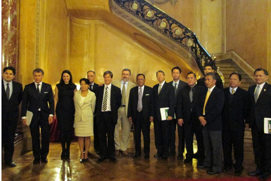
คณะผู้แทนกลุ่มมิตรภาพฯ ไทย-อาร์เจนตินา ถ่ายภาพร่วมกับเจ้าหน้าที่กระทรวงการต่างประเทศและผู้แทนบริษัท INVAP

จากนั้น คณะผู้แทนกลุ่มมิตรภาพฯ ไทย-อาร์เจนตินา ร่วมถ่ายภาพกับผู้แทนจากกระทรวงการต่างประเทศอาร์เจนตินาและผู้แทนจากบริษัท INVAP