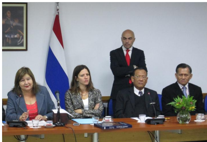
จากภาพ (ซ้ายไปขวา) รองประธานสภาผู้แทนราษฎร ประธานกลุ่มมิตรภาพฯ อาร์เจนตินา-อาเซียน ประธานกลุ่มมิตรภาพฯ ไทย-อาร์เจนตินา รองประธานกลุ่มมิตรภาพฯ ไทย-อาร์เจนตินา