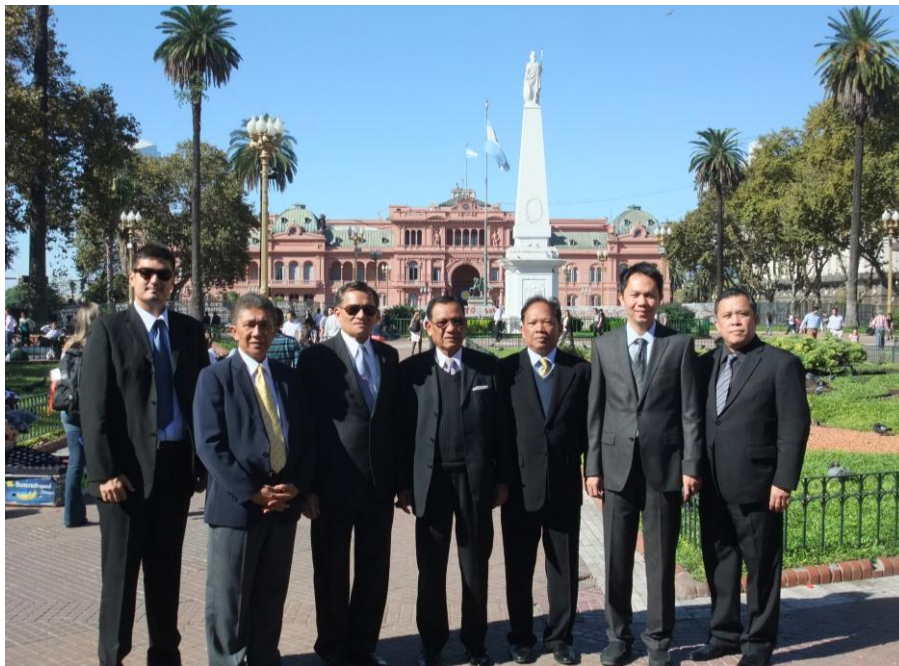
คณะผู้แทนฯ ถ่ายภาพด้านหน้าทำเนียบประธานาธิบดี

ทำเนียบประธานาธิบดี หรือ “ลา กาซาโร ซาดา” (Casa Rosada ) แปลว่าบ้านสีชมพูหรือบ้านสีกุหลาบ เพราะใช้หินสีชมพูก่อสร้าง ตั้งตระหง่านอยู่หน้าจัตุรัสมาโย