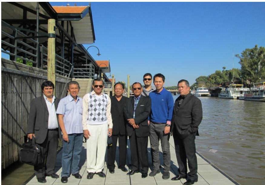
คณะผู้แทนฯ เยี่ยมชมสามเหลี่ยมปากแม่น้ำ

สายหลัก ๓ สาย คือแม่น้ำ Parana Guazu, Parana Mini และ Parana de las Palmas บริเวณดังกล่าวเป็นแหล่งพืชพันธุ์และสัตว์หลากหลายชนิด ปัจจุบันมีประชากรอาศัยอยู่บริเวณปากแม่น้ำประมาณ ๓,๐๐๐ คน