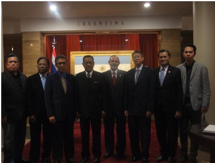
คณะผู้แทนกลุ่มมิตรภาพฯ ไทย-อาร์เจนตินา ถ่ายภาพร่วมกับผู้บริหารอนุสาวรีย์ธง