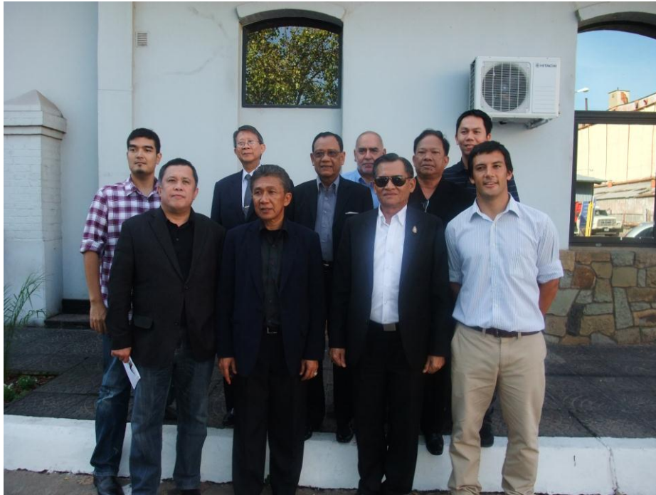
คณะถ่ายภาพร่วมกันกับผู้แทนของบริษัท TPR S.A.

จากนั้น ได้นำคณะเยี่ยมชมบริเวณต่างๆ และโครงการพัฒนาของบริษัทภายในบริเวณท่าเทียบเรือ และได้ถ่ายภาพร่วมกับคณะผู้แทนฯ ก่อนคณะจะทำพิธีอำลา