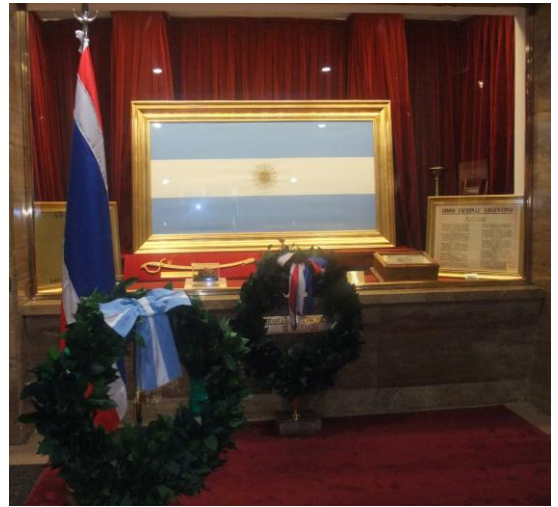
พิธีวางพวงมาลา ณ อนุสาวรีย์ธง