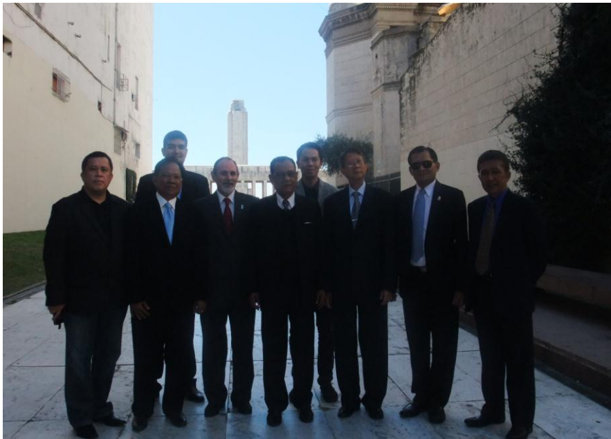
คณะผู้แทนฯ ถ่ายภาพร่วมกันบริเวณด้านนอกอนุสาวรีย์ธง