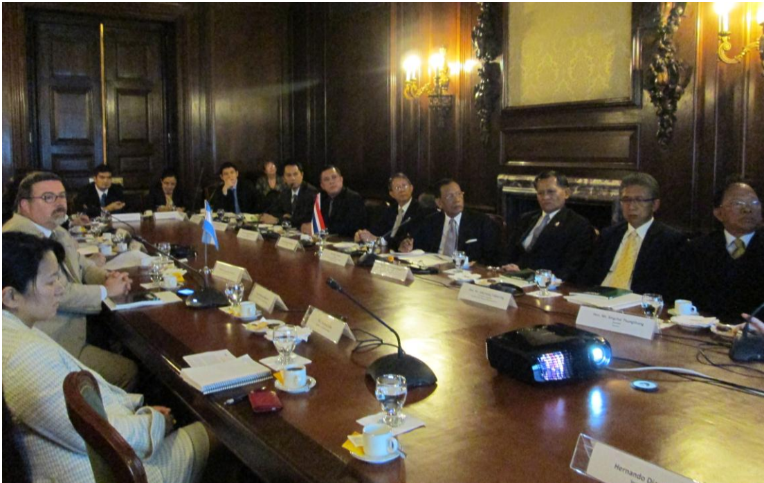
การรับฟังการบรรยายจากผู้แทนบริษัท INVAP

ตัวแทนบริษัท INVAP ได้นำเสนอเกี่ยวกับบริษัทในแผนกนิวเคลียร์ในเรื่องต่างๆ ประกอบด้วย ปัญหาในการทำงานของบริษัท คือ นำส่งโครงการทางเทคโนโลยีที่ซับซ้อน ออกแบบและก่อสร้างสิ่งอำนวยความสะดวกที่ซับซ้อน พัฒนาและออกแบบโปรแกรมในการทดสอบซอฟต์แวร์ การทำงานภายใต้เงื่อนไขมาตรฐานคุณภาพที่เข้มงวด โดยสินค้าและบริการของบริษัท ได้แก่ งานวิจัยเครื่องปฏิกรณ์ โรงงานในการผลิตไอโซโทปรังสี การอำนวยความสะดวกในการประกอบเชื้อเพลิงนิวเคลียร์ การเสริมสมรรถนะยูเรเนียม การกำจัดทริเทียมจากน้ำมวลหนัก และการบริการสำหรับโรงงานพลังงานนิวเคลียร์ โครงการของบริษัท INVAP ในประเทศไทย ตั้งอยู่ที่องค์กรฯ จังหวัดนครนายก โดยสถาบันเทคโนโลยีนิวเคลียร์แห่งชาติเป็นเจ้าของโครงการ ดำเนินการเกี่ยวกับเครื่องปฏิกรณ์ตัวใหม่ของไทย การผลิตไอโซโทปรังสี และสิ่งอำนวยความสะดวกในการจัดการและกักเก็บของเสีย ทั้งนี้ ไอโซโทปรังสีมีการนำไปใช้ในการแพทย์ ชีววิทยา การวิจัยและการพัฒนา การศึกษา การเกษตร อุตสาหกรรม และความปลอดภัย จากนั้น คณะได้สอบถามตัวแทนบริษัท INVAP เกี่ยวกับโครงการของบริษัทในประเทศไทย