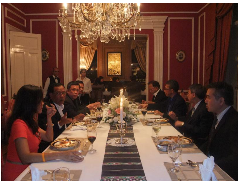
งานเลี้ยงรับรองอาหารค่ำแก่คณะผู้แทนกลุ่มมิตรภาพฯ ไทย-อาร์เจนตินา ณ ทำเนียบเอกอัครราชทูตฯ

๓. งานเลี้ยงรับรองอาหารค่ำเพื่อเป็นเกียรติแก่คณะฯ โดยนายเมธา พร้อมเทพ เอกอัครราชทูต ณ กรุงบัวโนสไอเรส เป็นเจ้าภาพ ในวันศุกร์ที่ ๒๕ เมษายน พ.ศ. ๒๕๕๖ เวลา ๑๙.๓๐ นาฬิกา ณ ทำเนียบเอกอัครราชทูตฯ