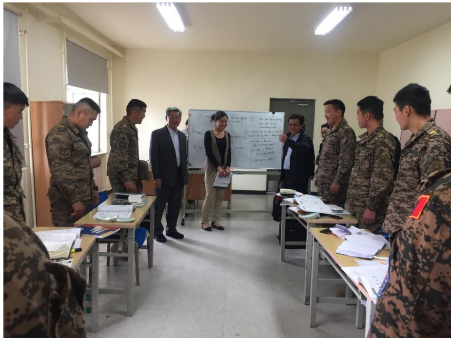
คณะได้เยี่ยมชม PKO Training Center