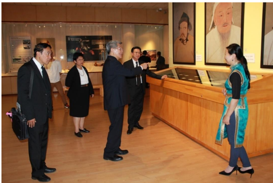
คณะได้เยี่ยมชมพิพิธภัณฑ์แห่งชาติมองโกเลีย (National Museum of Mongolia)

พิพิธภัณฑ์แห่งชาติมองโกเลียสร้างขึ้นเมื่อปี ๒๕๑๔ เป็นพิพิธภัณฑ์ที่ใหญ่ที่สุดในประเทศ ปัจจุบันได้เก็บรักษาวัตถุโบราณไว้มากกว่า ๕๗,๐๐๐ ชิ้น โดยวัตถุโบราณที่มีแสดงแบ่งเป็นประวัติศาสตร์เอเชียกลางและประวัติศาสตร์มองโกเลีย เริ่มตั้งแต่มองโกเลียยุคก่อนประวัติศาสตร์จนถึงช่วงสิ้นศตวรรษที่ ๒๐ โดยภายในพิพิธภัณฑ์ได้แบ่งห้องแสดงออกเป็น ๑๐ ห้อง ได้แก่ ห้องแสดงประวัติศาสตร์มองโกเลียยุคโบราณ ห้องแสดงเสื้อผ้าและเครื่องประดับชาวมองโกลสมัยก่อน ห้องแสดงจักรวรรดิมองโกเลีย ห้องแสดงวัฒนธรรมดั้งเดิมมองโกเลีย ห้องแสดงวิถีชีวิตของชาวมองโกลโบราณ ห้องแสดงประวัติศาสตร์มองโกเลียในช่วงศตวรรษที่ ๑๗-๒๐ ห้องแสดงประวัติศาสตร์มองโกเลียช่วง พ.ศ. ๒๔๕๔-๒๔๖๓ ห้องแสดงประวัติศาสตร์มองโกเลียช่วงสังคมนิยมมองโกเลีย ๒๔๖๔-๒๕๓๓ และห้องแสดงประวัติศาสตร์มองโกเลียช่วง ๒๕๓๓-ปัจจุบัน