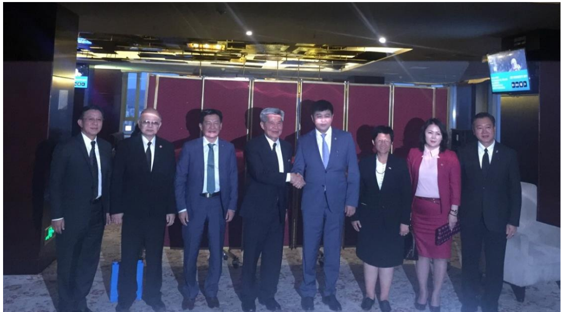
Hon. Mr. Khayangaa Bolorchuluun ประธานกลุ่มมิตรภาพรัฐสภามองโกเลีย-ไทย เป็นเจ้าภาพเลี้ยงอาหารค่ำเพื่อเป็นเกียรติแก่คณะ