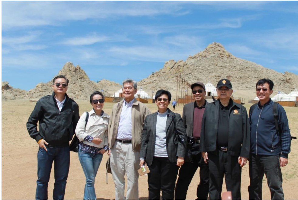
13th Century Complex