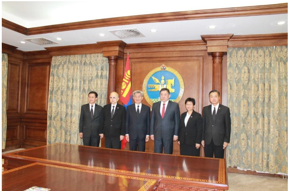
การประชุมทวิภาคีกับ H.E. Mr. Miyegombo Enkhbold ประธานรัฐสภามองโกเลีย