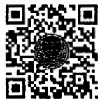
หนังสือนัดประชุม และระเบียบวาระการประชุม สภาผู้แทนราษฎร

เอกสารประกอบการประชุมสภาผู้แทนราษฎร ได้เผยแพร่ทางสื่ออิเล็กทรอนิกส์ ตามข้อบังคับฯ ข้อ ๒๑ วรรคหนึ่ง เรียบร้อยแล้ว โดยท่านสมาชิกฯ สามารถอ่านเอกสารประกอบการประชุมได้ โดยการสแกน QR Code หรือทาง www.parliament.go.th