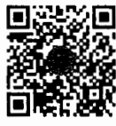
กระทู้ถามสด ด้วยวาจา