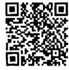
เอกสารประกอบ การพิจารณา สำนักวิชาการ