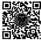
หนังสือนัดประชุม และระเบียบวาระการประชุม สภาผู้แทนราษฎร

เอกสารประกอบการประชุมสภาผู้แทนราษฎร ได้เผยแพร่ทางสื่ออิเล็กทรอนิกส์ ตามข้อบังคับฯ ข้อ ๒๑ วรรคหนึ่ง เรียบร้อยแล้ว โดยท่านสมาชิกฯ สามารถอ่านเอกสารประกอบการประชุมได้ โดยการสแกน QR Code หรือทาง www.parliament.go.th