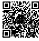
กระทู้ถามสด ด้วยวาจา