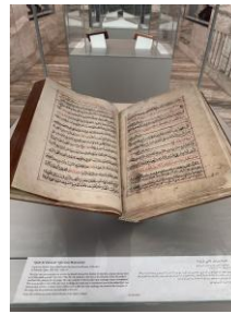
บริเวณชั้นใต้ดินของหอสมุดเก็บรักษาคัมภีร์อัลกุรอานโบราณ และคัมภีร์อัลกุรอานของรัฐกาตาร์

หอสมุดแห่งชาติกาตาร์ทำหน้าที่ครอบคลุมทั้งในฐานะหอสมุดแห่งชาติ หอสมุดวิชาการ และหอสมุดสาธารณะในทีเดียวกัน โดยมีวิสัยทัศน์คือ การเรียนรู้ตลอดชีวิต ทั้งยังเป็นศูนย์กลางกิจกรรมทางวิชาการ การเสวนา และความร่วมมือระหว่างประเทศ สะท้อนบทบาทของกาตาร์ในการส่งเสริมการศึกษา วัฒนธรรม และการแลกเปลี่ยนองค์ความรู้ในโลกทรัพยากรในหอสมุดแห่งชาติกาตาร์ สนับสนุนให้เกิดการวิจัย และการพัฒนาทรัพยากรมนุษย์อย่างยั่งยืน