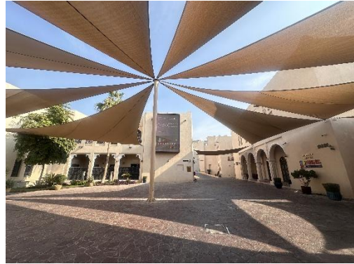
คณะผู้แทนเยี่ยมชมหมู่บ้านวัฒนธรรม

หมู่บ้านวัฒนธรรม Katara เป็นสถานที่ท่องเที่ยวแห่งใหม่ของกาตาร์ คำว่า Katara เป็นภาษาอาหรับ แปลว่า กาตาร์ หมู่บ้านแห่งนี้เป็นสถานที่รวบรวมการดำเนินงานด้านวัฒนธรรมที่สำคัญของกาตาร์และโลกอาหรับ ภายในหมู่บ้านประกอบด้วย โรงละครกลางแจ้ง โรงดนตรีออร์เคสตรา สมาคมและชมรมศิลปะ ร้านอาหารนานาชาติ ตลาดท้องถิ่นจำลอง และชายหาดสำหรับพักผ่อนหย่อนใจ หมู่บ้านแห่งนี้ยังใช้เป็นสถานที่จัดงานและนิทรรศการทางศิลปะและวัฒนธรรมตลอดทั้งปี