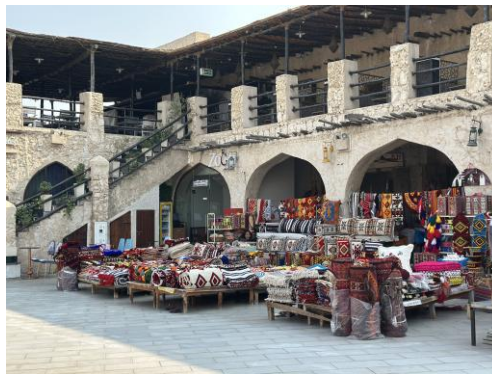
ตลาดซุก วากีฟ

ตลาดซุก วากีฟ เป็นสถานที่ท่องเที่ยวที่สำคัญของกาตาร์ โดยแต่เดิมเป็นตลาดท้องถิ่นสำหรับชาวกาตาร์และผู้ที่ย้ายมาอาศัยอยู่ในกาตาร์ได้มาจับจ่ายใช้สอยหลังพระอาทิตย์ตกดิน ซึ่งในขณะนั้นตลาดยังมีความเก่าแก่และค่อนข้างเสื่อมโทรม จนกระทั่งในปี ๒๕๔๗ อดีตเจ้าผู้ครองรัฐกาตาร์ได้รับสั่งให้ปรับปรุงสถานที่ให้มีกลิ่นอายความเป็นวัฒนธรรมกาตาร์และมีความสะอาดมากขึ้นเนื่องจากอยู่ติดกับพระราชวัง จนปัจจุบันกลายเป็นแหล่งท่องเที่ยวที่สำคัญของกาตาร์ ตลาดแห่งนี้ขายสินค้าพื้นเมืองนานาชนิด อาทิ อาหาร น้ำหอม เสื้อผ้า เครื่องดนตรีพื้นเมือง อุปกรณ์ตกแต่งบ้าน สัตว์เลี้ยง ภาพเขียนเรือท้องถิ่นของกาตาร์ เป็นต้น นอกจากนี้ ตลาดแห่งนี้ยังมีชื่อเสียงในฐานะที่เป็นที่ตั้งของร้านอาหารจากประเทศอาหรับต่าง ๆ ซึ่งประชาชนและนักท่องเที่ยวนิยมมารับประทานอาหารรวมถึงการสูบบุหรี่ท้องถิ่นของชาวอาหรับอีกด้วย