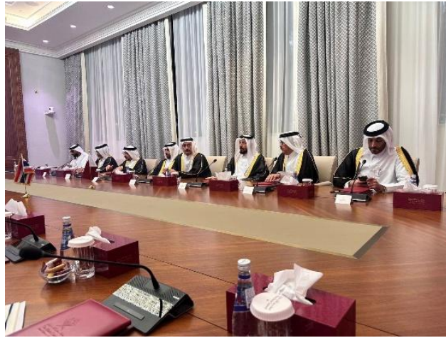
สมาชิกกลุ่มมิตรภาพสมาชิกรัฐสภากาตาร์-เอเชีย