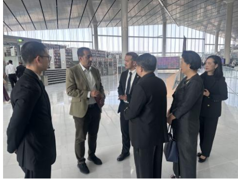
คณะผู้แทนกลุ่มมิตรภาพฯ ไทย-กาตาร์ เยี่ยมชมหอสมุดแห่งชาติกาตาร์

เมื่อวันพุธที่ ๓ ธันวาคม ๒๕๖๘ คณะผู้แทนกลุ่มมิตรภาพฯ ไทย-กาตาร์ เดินทางเข้าเยี่ยมชมหอสมุดแห่งชาติกาตาร์ (Qatar National Library: QNL) โดยมีเจ้าหน้าที่หอสมุดแห่งชาติให้การต้อนรับ จากนั้น เจ้าหน้าที่หอสมุดแห่งชาตินำชมส่วนต่าง ๆ ของหอสมุด