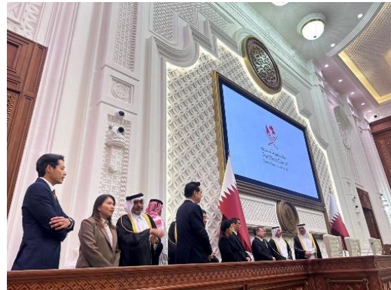
นายอาหมัด บิน ฮิฎมี อัล-ฮิฎมี ประธานกลุ่มมิตรภาพสมาชิกรัฐสภากาตาร์-เอเชีย นำคณะผู้แทนกลุ่มมิตรภาพฯ ไทย-กาตาร์เยี่ยมชมห้องประชุมสภาที่ปรึกษา รัฐสภาตาร์

ภายหลังเสร็จสิ้นการหารือทวิภาคี นายอาหมัด บิน ฮิฎมี อัล-ฮิฎมี ประธานกลุ่มมิตรภาพรัฐสภากาตาร์-เอเชีย ได้นำคณะผู้แทนฯ เข้าเยี่ยมชมห้องประชุมสภาที่ปรึกษา ภายในอาคารสภาที่ปรึกษาด้วยตนเอง