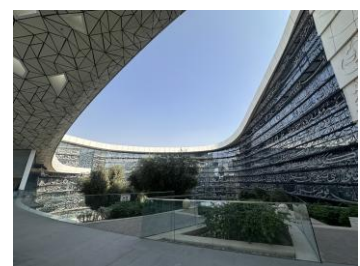
บริเวณมัสยิดแห่งเมืองการศึกษา รัฐกาตาร์