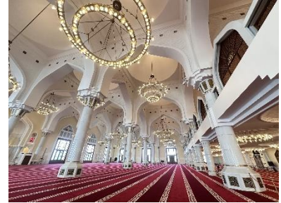
มัสยิดกลางแห่งรัฐกาตาร์

มัสยิดแห่งนี้มีรูปแบบสถาปัตยกรรมที่ผสมผสานอัตลักษณ์ของวัฒนธรรมอาหรับร่วมสมัยอย่างงดงาม นับเป็นศาสนสถานสำคัญของรัฐกาตาร์ที่ตั้งอยู่ใจกลางกรุงโดฮาในปัจจุบัน