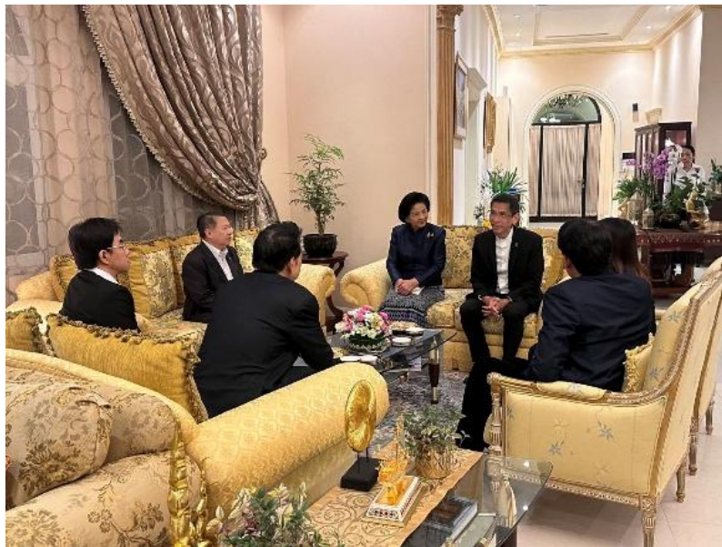
นายศิระ สว่างศิลป์ เอกอัครราชทูต ณ กรุงโดฮา บรรยายสรุปความสัมพันธ์ไทย-กาตาร์แก่คณะผู้แทนกลุ่มมิตรภาพสมาชิกรัฐสภาไทย-กาตาร์

เมื่อวันอังคารที่ ๒ ธันวาคม ๒๕๖๘ เวลา ๑๘.๓๐ น. ณ ทำเนียบเอกอัครราชทูต ณ กรุงโดฮา คณะผู้แทนกลุ่มมิตรภาพฯ ไทย-กาตาร์ เข้ารับฟังการบรรยายสรุปความสัมพันธ์ไทย-กาตาร์ จากนายศิระ สว่างศิลป์ เอกอัครราชทูต ณ กรุงโดฮา โดยมีข้าราชการสถานเอกอัครราชทูตเข้าร่วมให้ข้อมูลด้วย โดยเอกอัครราชทูตฯ ได้กล่าวถึงความสัมพันธ์อันยาวนานระหว่างสองประเทศที่ดำเนินมาอย่างราบรื่น โดยตลอด มีการแลกเปลี่ยนการเยือนระหว่างผู้นำระดับสูง ความสัมพันธ์ทั้งสองประเทศมีพลวัตในทุก ๆ ด้าน ไม่ว่าจะเป็นด้านการเมือง เศรษฐกิจ และสังคม วัฒนธรรม และการท่องเที่ยว