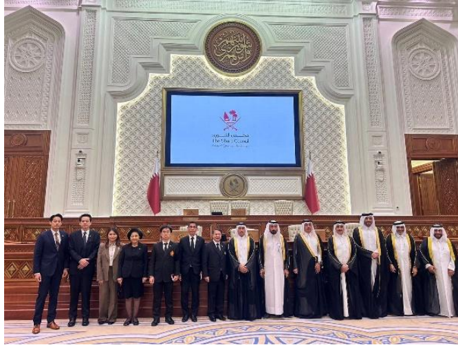
คณะผู้แทนกลุ่มมิตรภาพสมาชิกรัฐสภาไทย-กาตาร์ ถ่ายภาพร่วมกับคณะผู้แทนกลุ่มมิตรภาพสมาชิกรัฐสภากาตาร์-เอเชีย