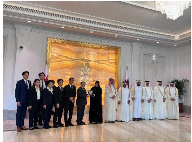
คณะผู้แทนกลุ่มมิตรภาพฯ ไทย-กาตาร์ถ่ายภาพร่วมกับรองประธานสภาที่ปรึกษาแห่งรัฐกาตาร์ และกลุ่มมิตรภาพสมาชิกรัฐสภากาตาร์-เอเชีย