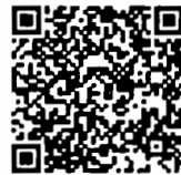
บันทึกการประชุมสภา สำนักrayงาน การประชุมและชวเลข