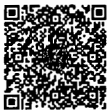
หนังสือนัดประชุม และระเบียบวาระการ ประชุมร่วมกันของรัฐสภา

เอกสารประกอบการประชุมร่วมกันของรัฐสภา ได้เผยแพร่ทางสื่ออิเล็กทรอนิกส์ ตามข้อบังคับ การประชุมรัฐสภา พ.ศ. ๒๕๖๓ ข้อ ๑๓ โดยท่านสมาชิกฯ สามารถอ่านเอกสารประกอบการประชุมได้ โดยการสแกน QR code ที่ปรากฏอยู่ในหนังสือนัดประชุม หรือทาง www.parliament.go.th