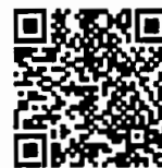
เอกสารประกอบการพิจารณา สำนักวิชาการ